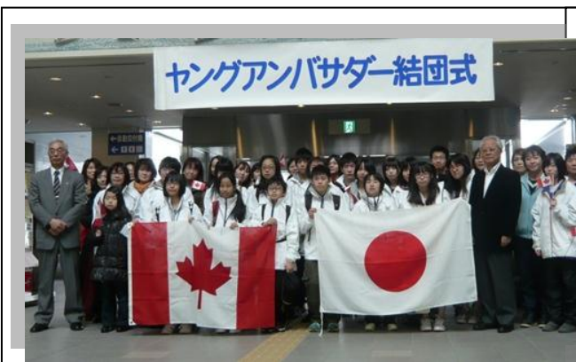
ヤングアンバサダー結団式

◆第13回目の「姉妹都市キャンベルリバー少年少女親善訪問団」(通称・ヤングアンバサダー)、一行19名(生徒16名・引率3名)は、行程中の5泊6日を姉妹都市キャンベルリバーでホームステイしながら、現地の学校を訪れたり、消防署や博物館などを見学して、地域の皆さんと交流を深めました。カナダの雄大な自然の中で、アウトドア活動にも参加し、全員無事に笑顔で帰国しました。