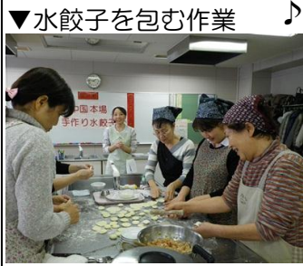
▼水餃子を包む作業

◆花川北コミュニティセンターにて開催されました。たくさんの方にご参加いただきました。初めての方も多かったようですが、皆さん上手に餃子の皮を作り、包んでいました。謝辞(シエシエ)♪